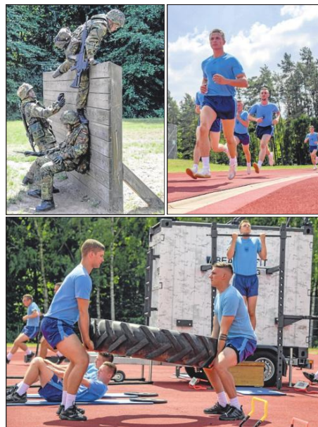
Gesucht: Schnelligkeit, Kraft, Ausdauer. Soldaten des Panzergrenadierbataillon 401 beim Training in Hagenow.